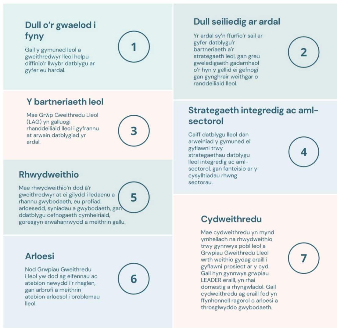
Ffigur 1.1: Dull LEADER: Saith Nodwedd